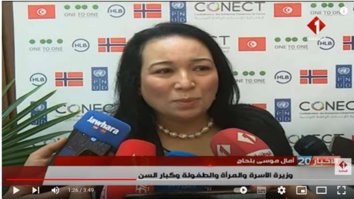
تظاهرة مقياس || 10 بالمائة من المؤسسات الصغرى و المتوسطة تسيرها نساء